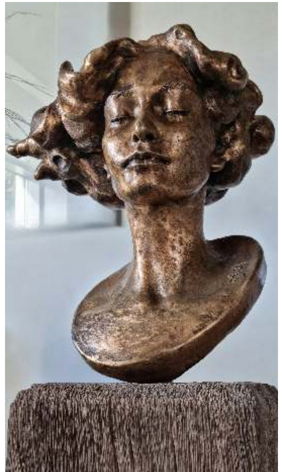
Arianne Moerman, Atmosfera , 2024; brons; h. 45 x 43 x 27 cm | sokkel h. 100 cm