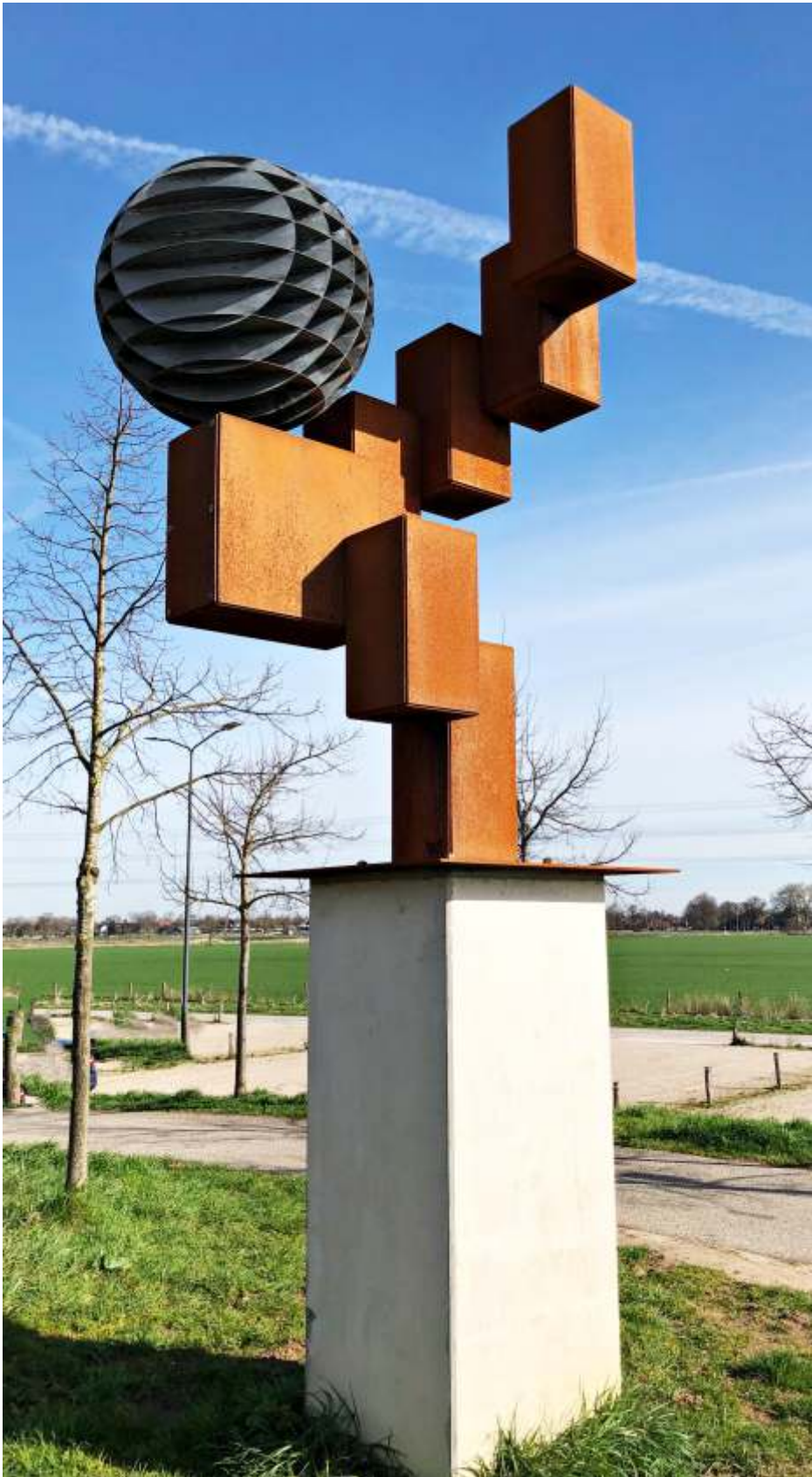
Han Lammers, π-thagoras , 2021; kubussen: cortenstaal, bol: zink 20, op betonnen sokkel; h. 500 x 120 x 120 cm, gewicht ca. 5 ton. Het beeld is geplaatst bij de baileybrug over de Oude IJssel nabij de voormalige DRU fabrieken in Ulft. Opdracht van gemeente Oude IJsselstreek in het kader van de Ring van IJzesteden