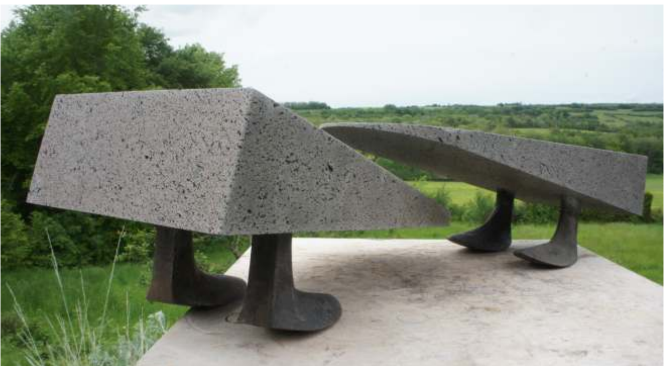
Bert Gort, Beweging en Tegenbeweging , 2024; basaltlava, gietijzer, ijzer; h. 20 x 40 x 20 cm elk.

“Ik werk abstract. Mijn thema's komen voort uit mijn dagelijkse ontmoetingen en belevenissen. Gevonden voorwerpen kunnen daarbij inspireren om een beeld een twist te geven die de gewenste verwondering met zich meebrengt. Steen als materiaal is voor mij een uniek middel om het beeld weer te geven en aan de vorm een extra dimensie toe te voegen. Maar ook materialen als metaal en rubber zijn mooie toevoegingen die een geheel andere twist aan de steen kunnen geven. Soms zijn het ook de materialen rubber en ijzer die afzonderlijk gebruikt worden.”