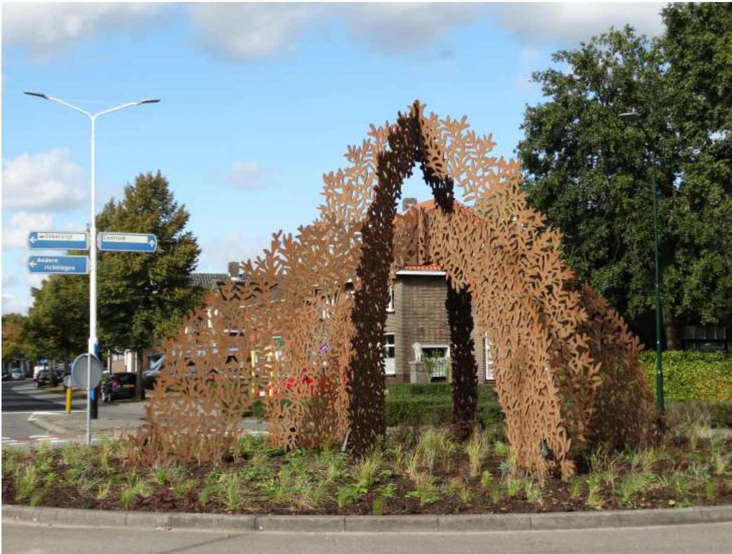
Juul Rameau, Poorten van Hoop , 2019; cortenstaal; h. 600 x 900 x 900 cm. Kanaalstraat Son en Breugel.