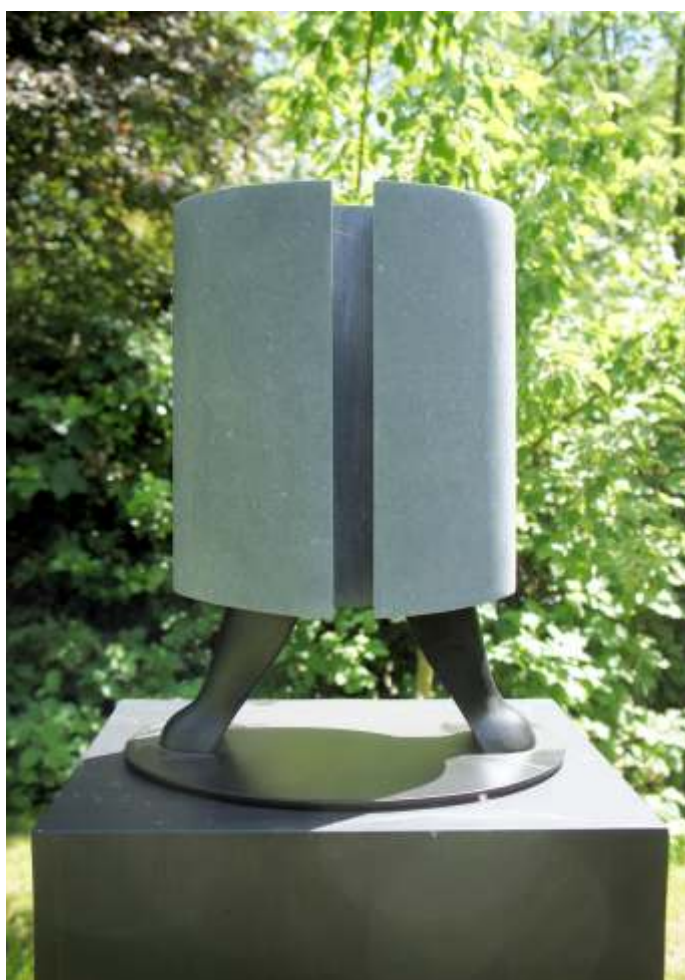
Bert Gort, Stavast , 2023; Belgisch hardsteen, gietijzer; h. 55 x 30 x 20 cm