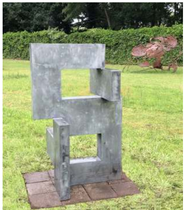
Han Lammers, Shared Flat III , 2017; zink 16; h. 150 x 100 x 70 cm.

Dit beeld is geplaatst in de beeldentuin van de Nederlandse Kring van Beeldhouwers in Soest