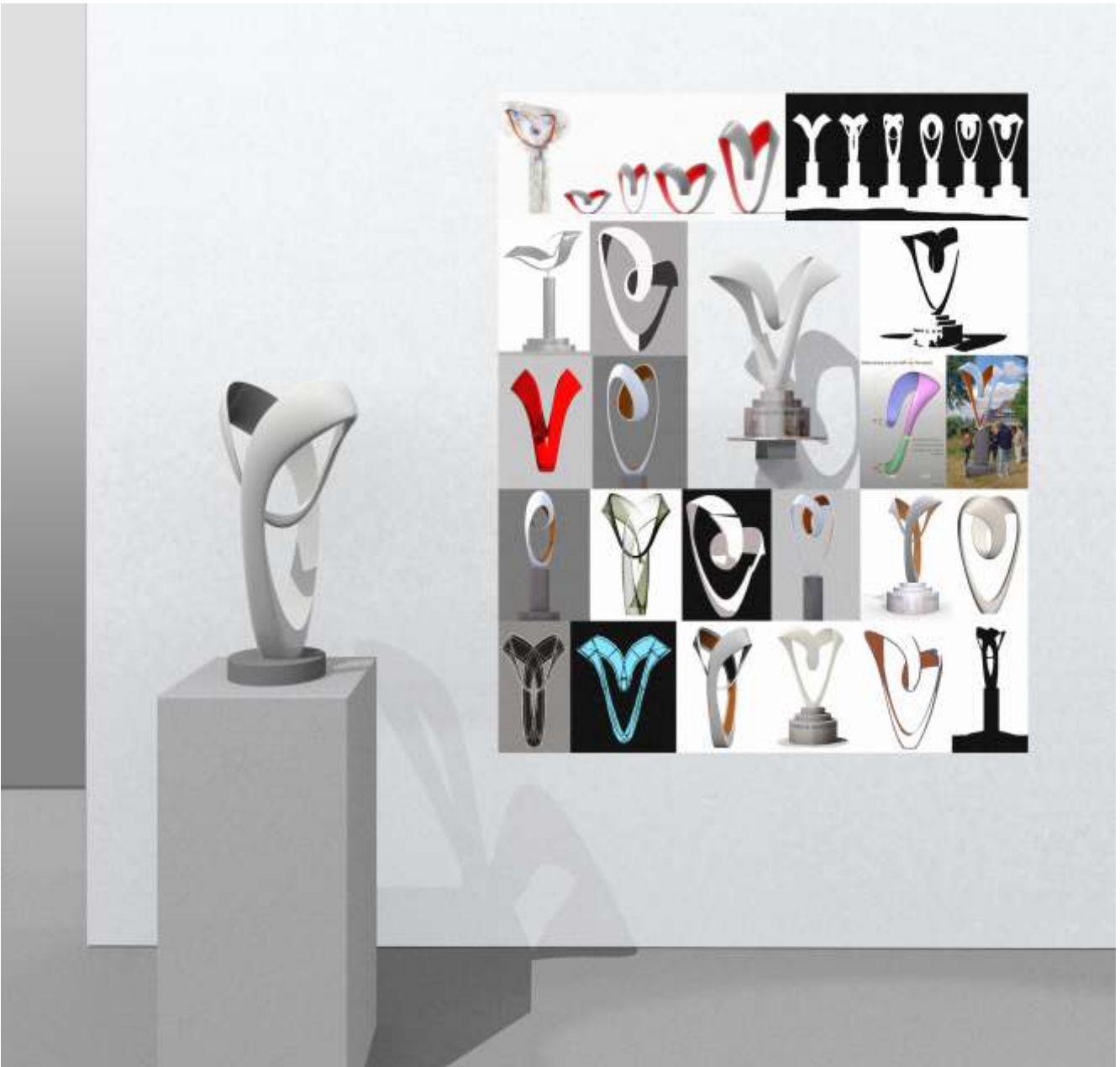
Ron van de Ven, presentatie werk met in het midden het schaalmodel van Vrijheid in verbondenheid en links op sokkel een tweede versie van Vrijheid in verbondenheid , 2026; gepolychromeerde PLM print; h. 56 x 53 x 23 cm