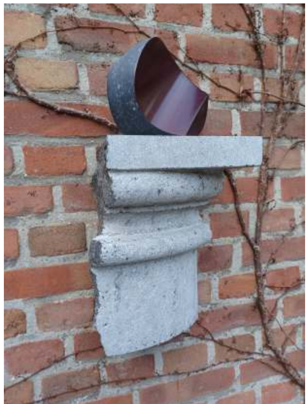
Adriaan Seelen, Morgan I , 2025; hardsteen, gepolychromeerd; h. 45 x 25 x 17 cm

Het beeld Emty Spasces III is te zien als een voorstudie voor de drie kleinere werken die binnen te zien zijn.