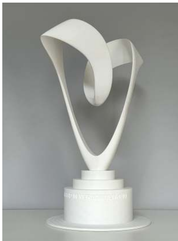
Ron van de Ven, Vrijheid in verbondenheid , 2026; gepolychromeerde PLM print; schaalmodel op sokkel h. 44 x 32 x 22 cm

Met dit nieuwe kunstwerk beoogt Boxtel een blijvende en betekenisvolle plek te bieden voor het vasthouden van de herinnering aan alle Nederlandse slachtoffers van conflicten sinds 1940 en het vieren van de daaropvolgende vrijheid.