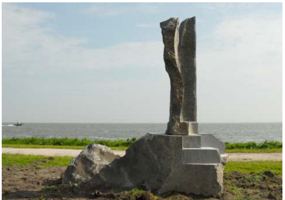
Caroline Ruizeveld, Uitkijkjurk , 2010; Belgisch hardsteen; h. 180 x 315 x 90 cm. Staat in Hoorn aan de kust.

Ook zien de ontwerpers onderdak voor een aantal Utrechtse bijenvolken. De kieren en hoeken van de Domstenen, evenals het materiaal kalksteen, zijn zeer geschikt om bijen te huisvesten.