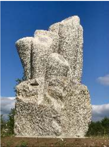
Cissy van der Wel, Take Root , 2021; muschelkalk; h. 270 x 120 x 120 cm. Staat in Altendorf/Bamberg, DE.

Caroline Ruizeveld is sinds 1985 beeldhouwer in steen. Ze werkt in haar atelier bij De Nijverheid, een ateliercomplex in Utrecht en neemt deel aan steensymposia in het buitenland. Ze maakt werk in opdracht en vrij werk.