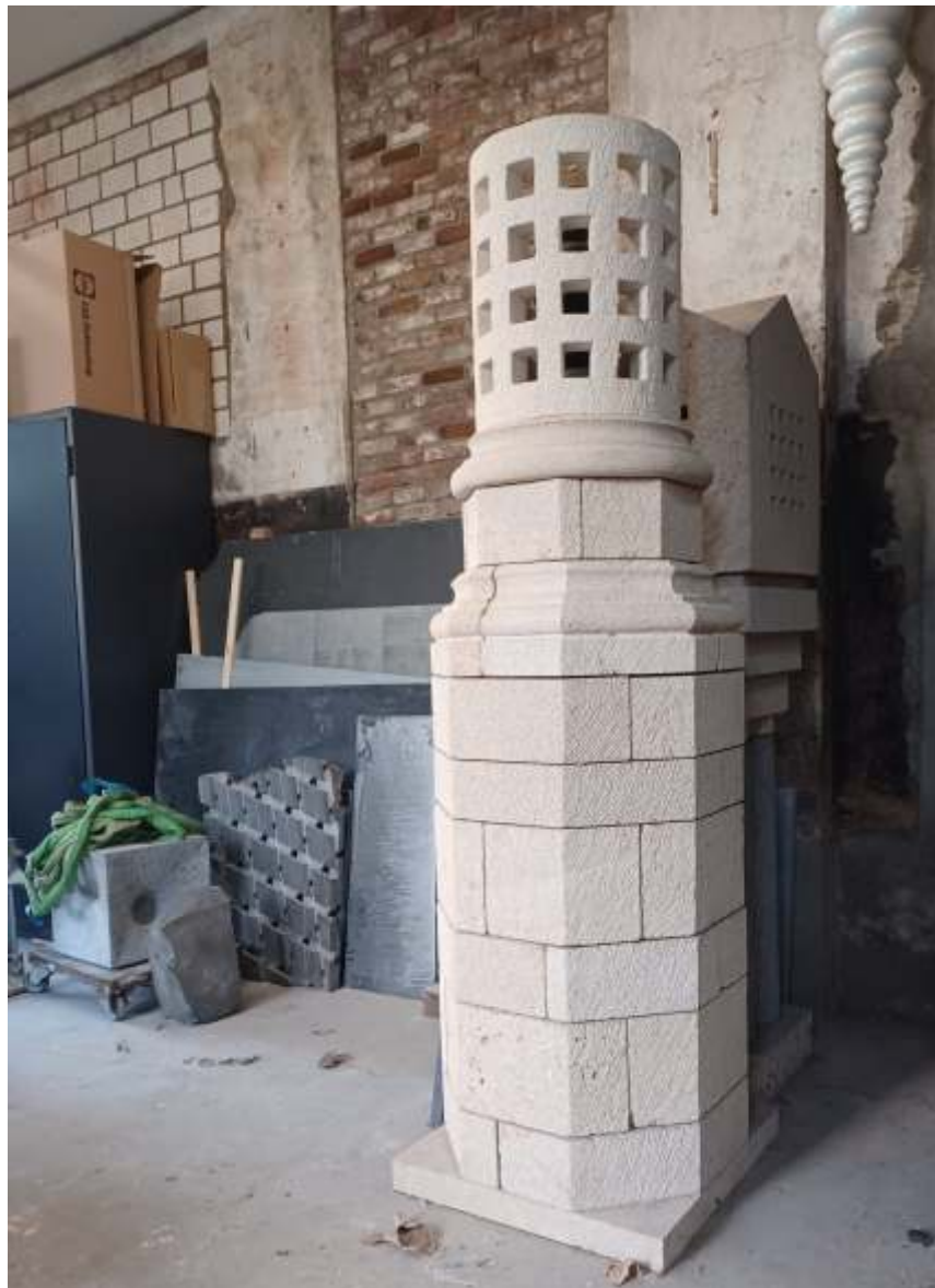
Adriaan Seelen, Empty Spaces III , 2009; euville / zwart marmer; h.200 cm