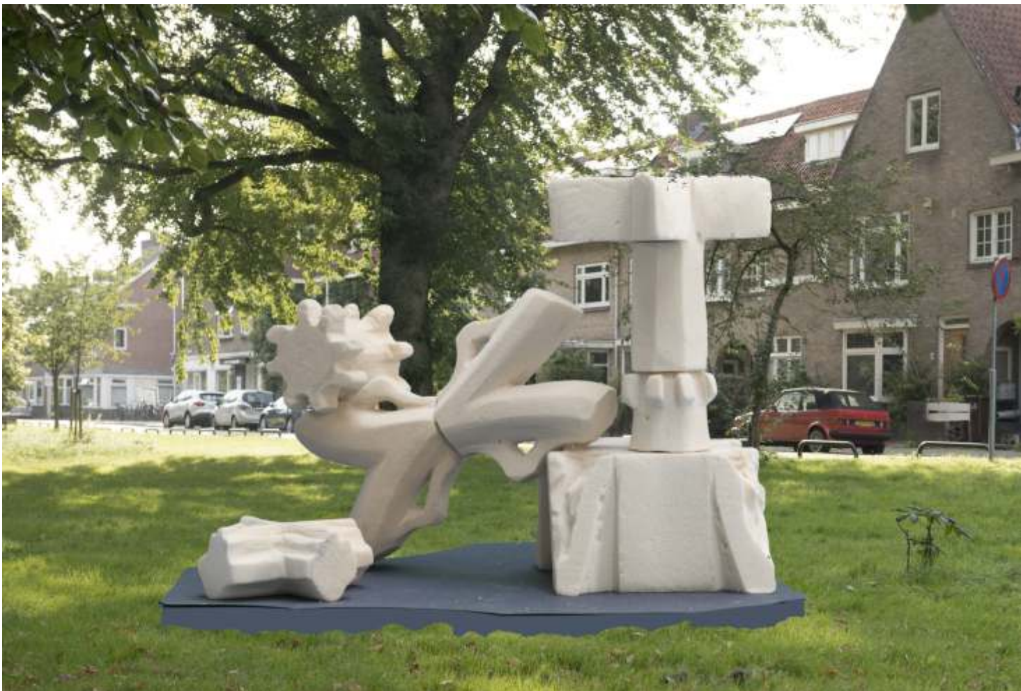
Cissy van der Wel en Caroline Ruizeveld, d'Homage , 2025; verweerde kalkstenen van de Utrechtse Domtoren; h. 300 x 350 x 250 cm