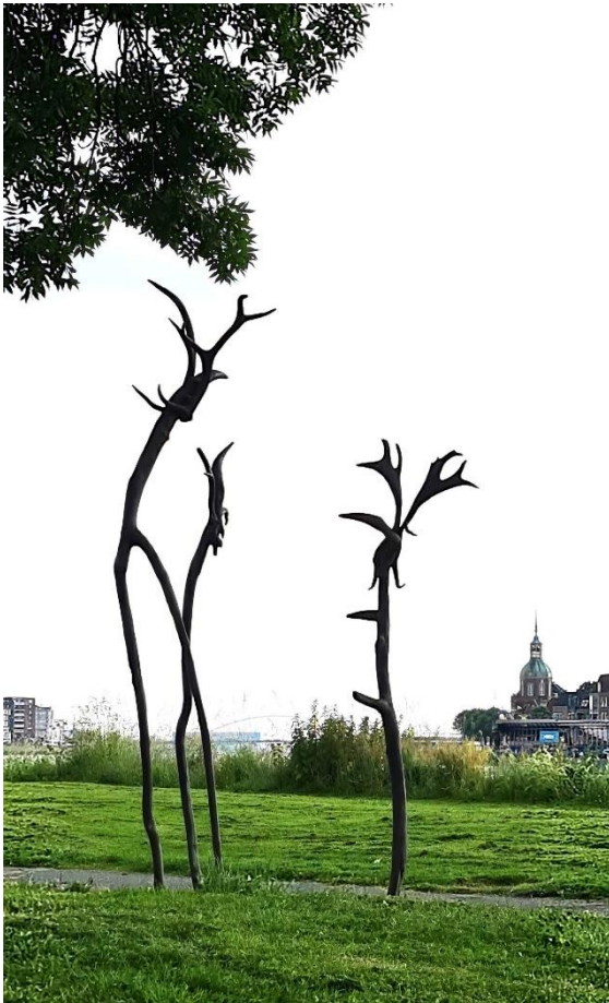
Gonda van der Zwaag

Echter, al na enkele dagen bleek dit beeld door vandalisme ernstig beschadigd te zijn. Hierna hebben wij dit beeld moeten repareren, waar opnieuw hoge kosten mee gemoeid waren. Inmiddels is het beeld weer herplaatst in de hoop dat kwade bosgeesten niet opnieuw zullen toeslaan.