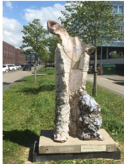
Rita van der Vegt

Het beeld EOS van de recent overleden Rita de Vegt is, na afloop van de met de gemeente overeengekomen huurperiode, verhuisd naar het Noordpark.