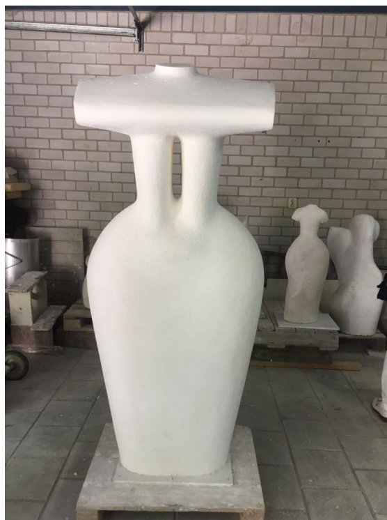
"TARA", Jan Timmer

22 april stond het atelierbezoek aan Jan Timmer op de agenda. Op deze zonovergoten zaterdag kwam een groot aantal Vrienden naar het atelier van Jan in het Wantij Park. Op inspirerend wijze vertelde Jan Timmer over zijn werk in het bijzonder en over de beeldende kunst in het algemeen. De woorden "beeldvorming" en "beeldbepalend" waren de ankers van zijn lezing. Werk van Jan Timmer maakt ook onderdeel uit van de tentoonstelling "Omzien" in het Dordrechts museum, waar o.a. zijn beeld "Tara" wordt geëxposeerd. Ook in het Noordpark en op de locatie Papendrecht staat werk van Jan Timmer.