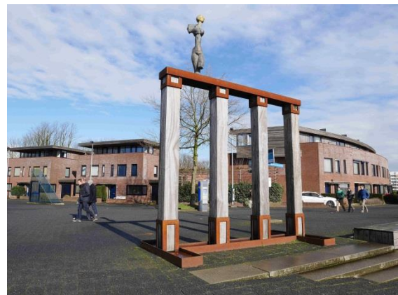
Engel op zuilengalerij